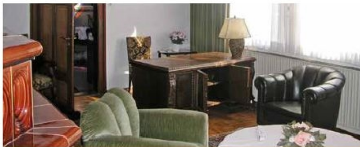
Wohnzimmer mit Einrichtung aus den 1930er Jahren

Hierzu zählen neben Möbeln auch Malereien an Decken, Wänden und Böden, aufwendige Holzdecken, Kachelöfen und Fliesen. Die Räume gewähren damit Einblicke in die damaligen Lebensbedingungen der Bevölkerung. Darüber hinaus geben restauratorische Freilegungen Eindrücke von der ursprünglichen Gestaltung der Räume.