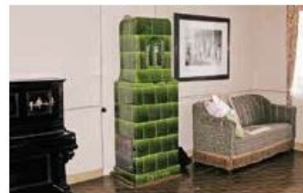
Der Salon mit Kachelofen und Bodenmalerei sowie einem Klavier des Braunschweiger Unternehmens Zelter und Winkelmann