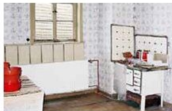
Die vom Tanzsaal provisorisch abgetrennte Kochgelegenheit der Flüchtlinge und Vertriebenen.

Die gleichen Unterkünfte dienten in den Nachkriegsjahren der Erstunterbringung von Flüchtlingen und Heimatvertriebenen aus Schlesien und Ostpreußen. Die Unterkünfte sind im Original zu besichtigen. Die ZeitRäume bieten auch für Schulklassen einen Lernort für hautnah erlebbaren Unterricht. Besuchergruppen bietet der im ehemaligen Pferdestall eingerichtete Seminarraum die Möglichkeit, die erlebten Eindrücke zu vertiefen.