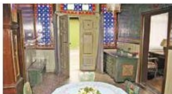
Eingangsbereich mit Bleiverglasung, historischer Wandmalerei und Bodenfliesen

der Gemeinde Vechelde befinden sich im 1878 errichteten Haupthaus des 3-Seit-Hofs, in dem bis 1934 auch eine Gaststätte mit Tanzsaal und Kegelbahn betrieben wurde. Die Räumlichkeiten verfügen über eine komplett erhaltene Originaleinrichtung aus verschiedenen Stilepochen.